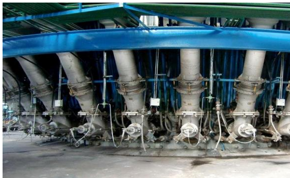
Conjunto de ventaneiras na parte inferior do alto-forno

A alta periculosidade da área de um alto forno dificulta o monitoramento e coloca operadores em situação de risco quando realizadas as vistorias e inspeções, que ocorrem com frequência extremamente baixa quando comparada ao monitoramento online.